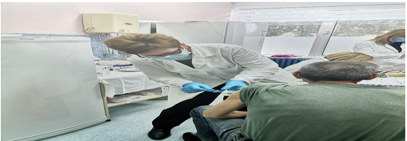
Слика број 5: Вакцинација

Последњег дана 2019. године здравствене власти НР Кине су известиле Светску здравствену организацију (СЗО) о појави више случајева респираторних инфекција код особа у граду Вухан. Као узрочник обољења идентификован је нови корона вирус (SARS-Cov-2) 7. јануара 2020. године, а болест је добила назив Covid-19. Први случајеви се повезују са рибљом пијацом, где се иначе продају животиње и живина. У Републици Србији се спроводе мере у складу са Законом о заштити становништва од заразних болести и Међународним здравственим правилником које укључују надзор над путницима који долазе из жаришта новог корона вируса и по потреби изолацију оболелих и здравствени надзор над контактима. Институт за јавно здравље Србије "Др Милан Јовановић Батут" у сарадњи са Министарством здравља и надлежним здравственим установама, прати епидемиолошку ситуацију болести изазване новим корона вирусом у свету (Ковид-19), и сходно новим сазнањима и препорукама Светске здравствене организације, издаје обавештења за јавност и упутства за поступање здравственим установама и другим надлежним органима и институцијама.