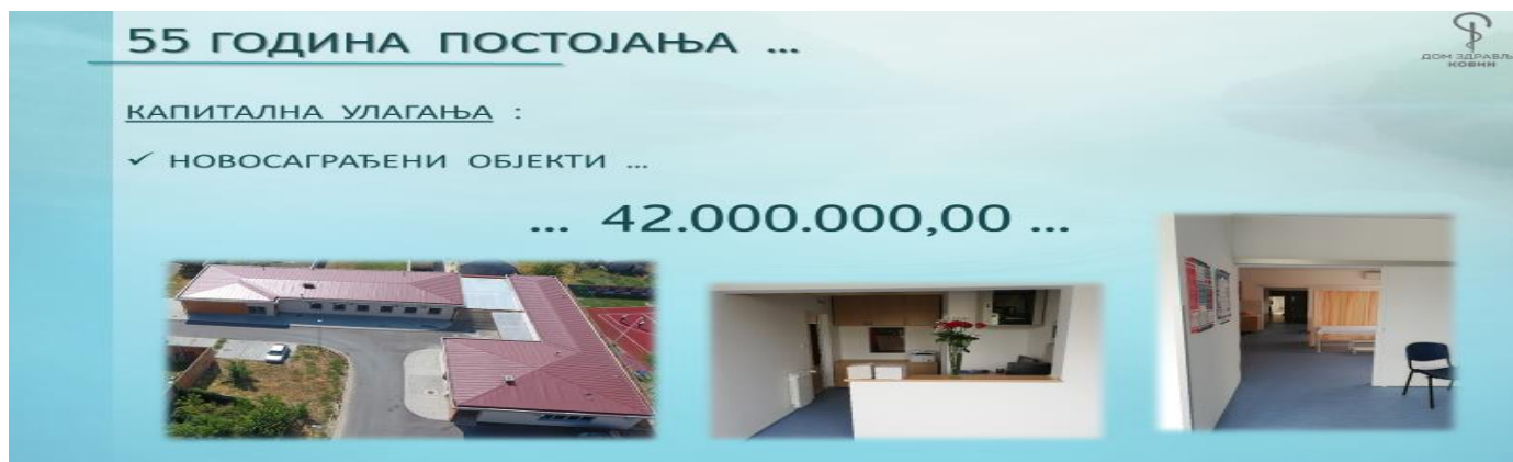
Слика број 1: Новосаграђени објекат-Амбуланта за респираторне инфекције, СХМП и Технички блок

Више од 40 година, у дом здравља, осим текућег одржавања није било капиталног улагања. Године 2019. на Дан општине Ковин, 04. октобра свечано је отворена нова зграда у којој су смештене Служба ХМП и технички блок укупне корисне површине 245 м 2 . До момента пресељења у нове просторије, Служба хитне медицинске помоћи је делила амбуланте са општом медицином у матичној згради у Ковину. Више од 10 година су биле две службе у једном простору. Даном пресељења, Служба хитне медицинске помоћи почиње да послује као посебна целина у новом простору. Располаже пространим амбулантом за хитне интервенције, превијалиштем, просторијом за праћење стања пацијената, лекарском собом, собом одговорне сестре и собом за возаче. Технички блок обухвата просторије које су намењене вешерају: прању, сушењу и пеглању веша. Пресељењем, просторно се растеретила општа медицина тако да и једна и друга служба могу квалитетније да се организују у обављању радних задатака. Рад Службе ХМП у новом простору се базира на прихватању новог начина организације. Стварамо делотворан систем у којем ће ургентна медицина у оквиру ПЗЗ-а бити одговарајућа за пацијента и свакако правовремена, односно пружа се онда када се препозна потреба. За потребе новоотворене зграде набављена је нова медицинска опрема: дефибрилатори, ЕКГ-и, инхалатори...негатоскоп. За потребе Техничког блока набављене су машине за прање веша. Комплетно капитално улагање као и опремање неопходном опремом финансирано је из Буџета општине Ковин.