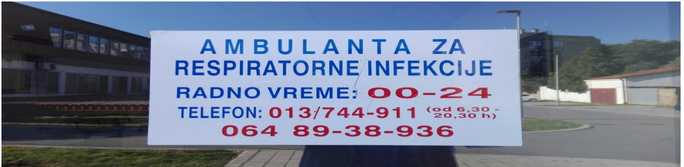
Слика број 4: Уређен партерни простор и радно време АРИ

У циљу спречавања појаве и ширења епидемије заразне болести и отклањању ризика за безбедан и здрав рад запослених као и лица која се затекну у радној околини донет је План примене мера за спречавање појаве и ширења епидемије заразне болести у Дому здравља „Ковин“ Ковин.