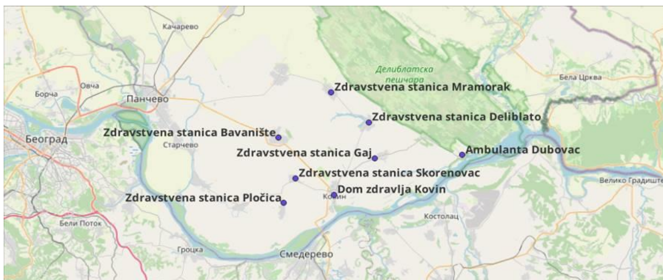
Слика број 2: План мреже здравствених станица у Општини Ковин

У наставку следи графички приказ мреже здравствених станица по насељеним местима Општине Ковин (Слика 2).